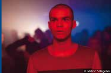
GELOBT SEI GOTT (FR 2019)