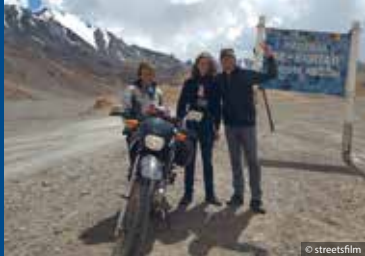
ÜBER GRENZEN (DE 2019)