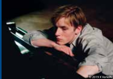
PRÉLUDE (DE 2019)

überführung mit einer reichen Gräfin verwechselt wird, erhält sie ihre Chance.