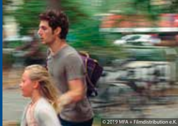
DIE BERUFUNG – IHR KAMPF FÜR GERECHTIGKEIT (US 2018)