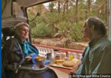
© 2019 Rise and Shine Cinema