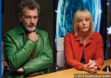
THE REMAINS – NACH DER ODYSSEE (AT 2019)