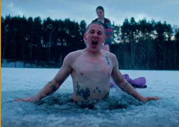
CHINA SEA (LT/TW/PL/CZ 2025)