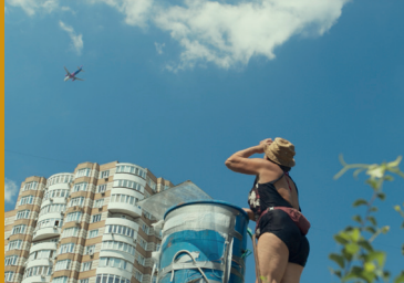
FLOWERS OF UKRAINE (UA/PL 2024)