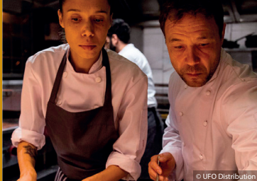
YES, CHEF! (GB 2021)