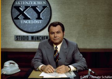
DIESE SENDUNG IST KEIN SPIEL (DE 2023)